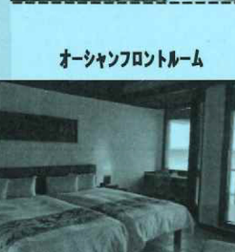
オシャンフロントルーム