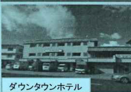
ダウンタウンホテル